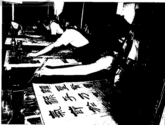
SMK Kuching High 古晋国民型中学学生参与校外活动“丙申年全国中学生华中堂书法比赛”

承诺有时可能只是一句话而已，有时却可能改变我们一生的命运。我们只需记住，兑现我们许下的诺言，永不食言。