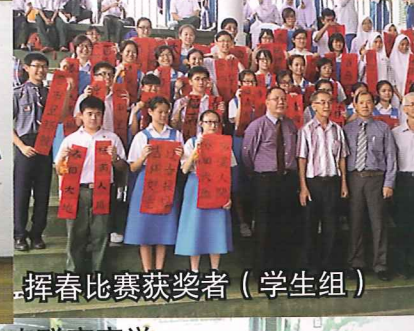
挥春比赛获奖者 (学生组)