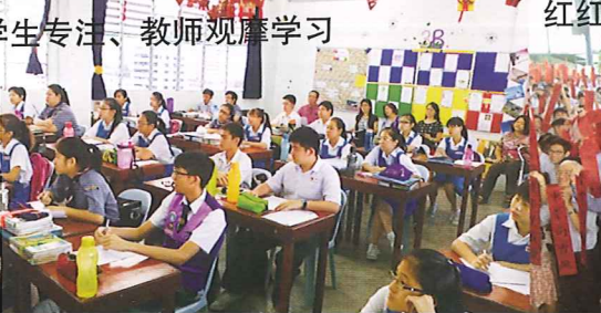
学生专注、教师观摩学习