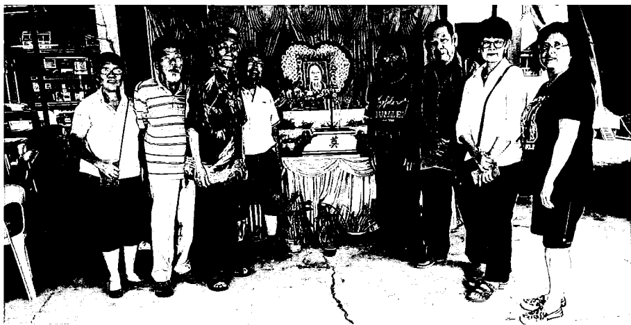
《燭火》同人与友好合照于唐珉灵前