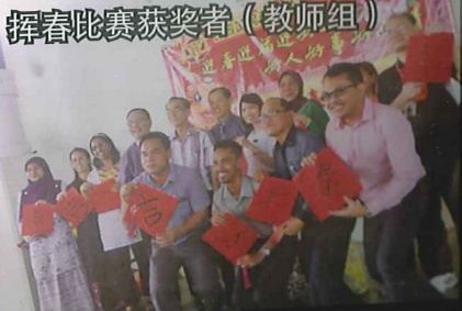
挥春比赛获奖者 (教师组)