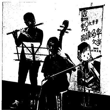
SMK Kuching High 古晋国民型中学2016文学营：“阅读马华文学”文学营余兴节目

一直要相信一句话，彩虹总在风雨后。路程是很艰辛没错，但只要走过陡峭的山坡，就一定能到达巅峰。现在就开始吧，趁还来得及的时候！